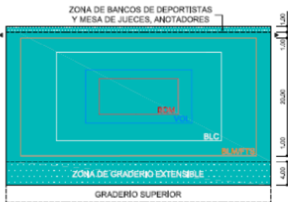
CAMPOS PRINCIPALES SB (27x45x7,5) 1215m 2

BDM BADMINTON BLC BALONCESTO BLM BALONMANO VOL VOLEIBOL FTS FUTBOL SALA